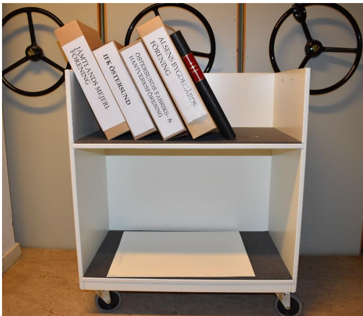
Bild 1 Arkivvagn med specialgjorda arkivvolymmer.