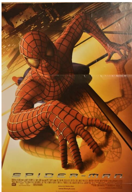
Bild 6 Bioaffisch Spider-man.