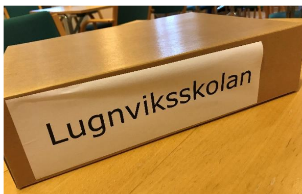
Bild 9 Klassens eget arkiv.

Vi plockar fram klassens kartong igen, och teckningarna/texterna läggs i omslag med datum och läggs ner i klassens kartong, så även pusselbilderna. Medskicket till eleverna blir att kartongen kommer nu att sparas på arkivet. "Och nästa vecka, om ett år eller när ni blir vuxna då kan ni komma hit och titta på era teckningar och berätta för de som är med er då, vad ni gjorde på Arkivet tillsammans!"