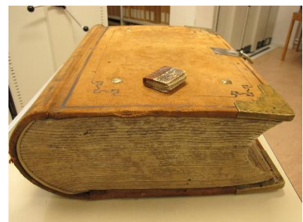
Bild 3 Stor och liten bok.

Det är alltså arkivets allra största bok, som väger 32 kg (en liggare från Riksbanken). Och den allra minsta, en nödbönbok från ett enskilt arkiv. Syftet: de är olika stora (!), skapat i olika tider: en är från 1900 talet och en från 1700-talet. Vi kan resonera kring begrepp stor och liten, äldst och yngst? Handskriven eller tryckt?