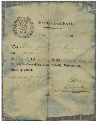
Bild 4 Äldsta dokumentet.